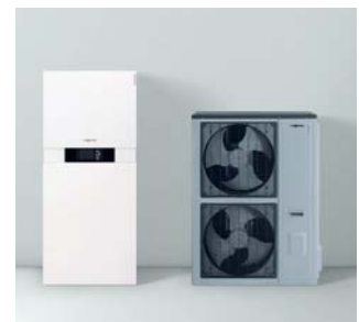
Inneneinheit Vitocaldens 222-F (links) mit silberner Außeneinheit (Typ 222.A29 SL)