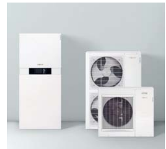
Inneneinheit Vitocaldens 222-F (links) mit den beiden weißen Außeneinheiten