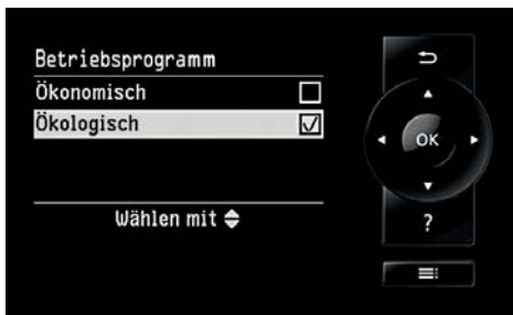
Regelung Vitotronic 200 mit Hybrid Pro Control: Ganz bequem wählen zwischen besonders sparsamer oder besonders umweltschonender Betriebsweise