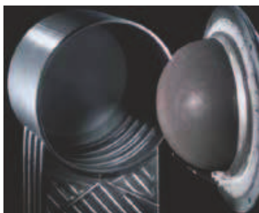
Matrix gorionik varijanta "nezavisan od vazduha u prostoriji"