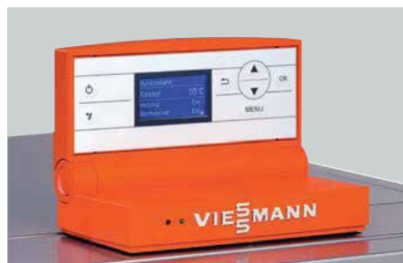
Vitotronic regulacija - jednostavno rukovanje zahvaljujući intuitivnom meniju